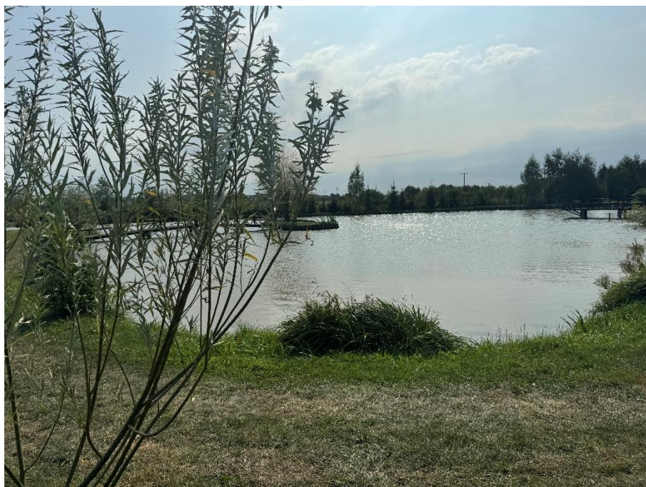
Krajobraz i przyroda w Burdajnach