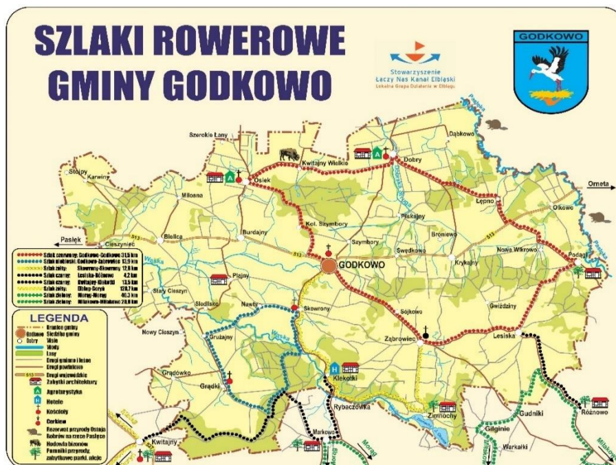
Szlaki Rowerowe Gminy Godkowo