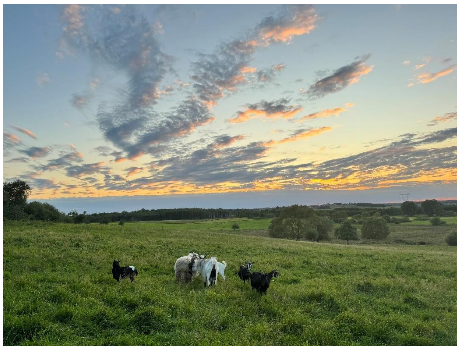
Krajobraz i przyroda w Burdajnach