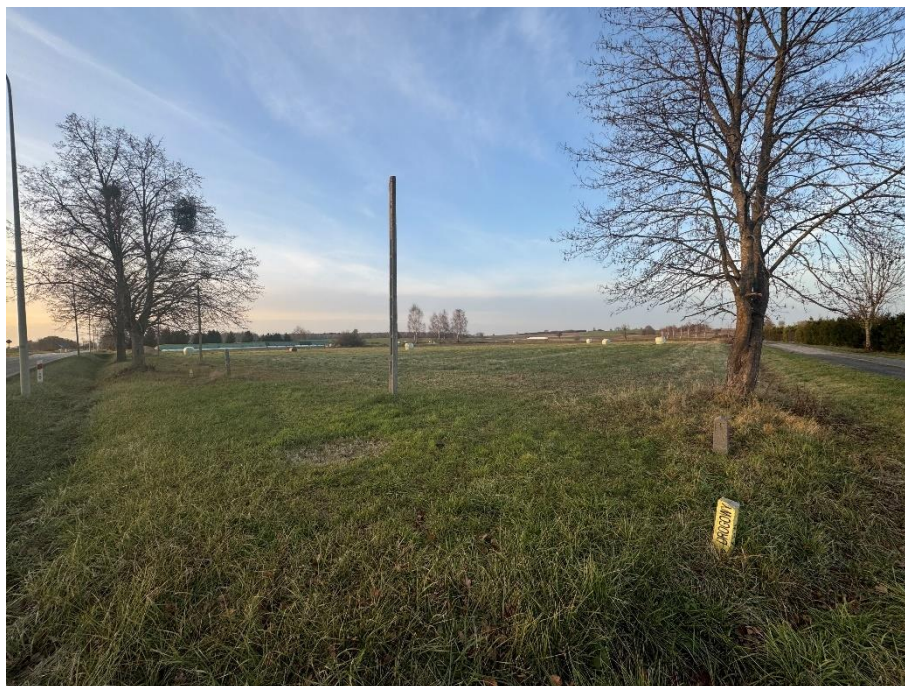
Boisko w Burdajnach