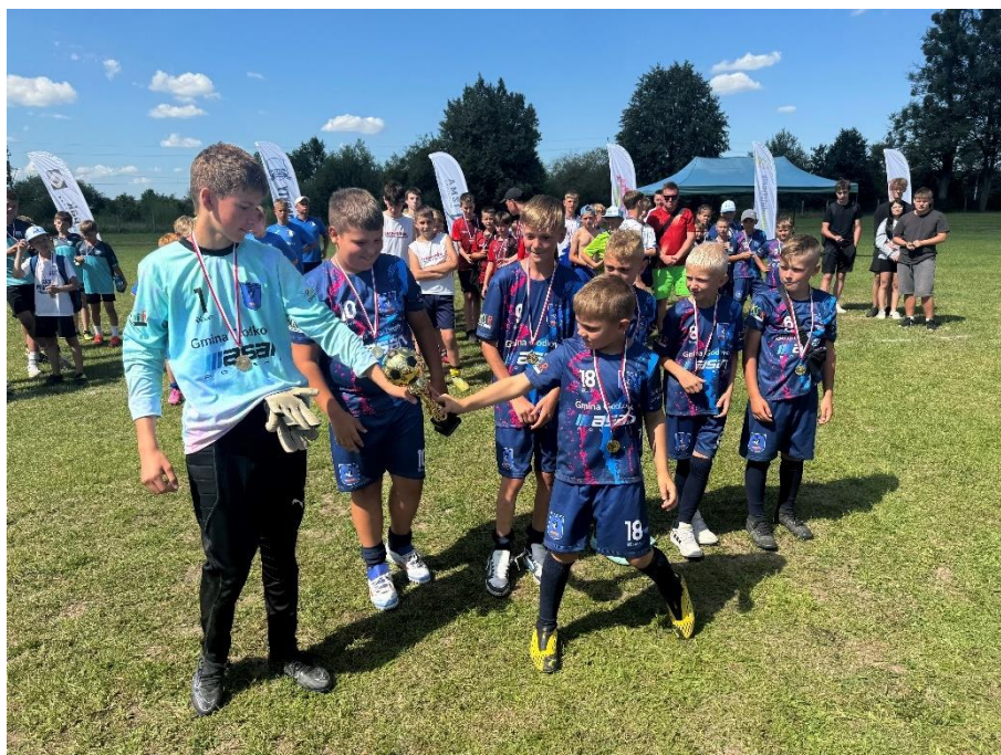
Drużyna piłkarska w Burdajnach