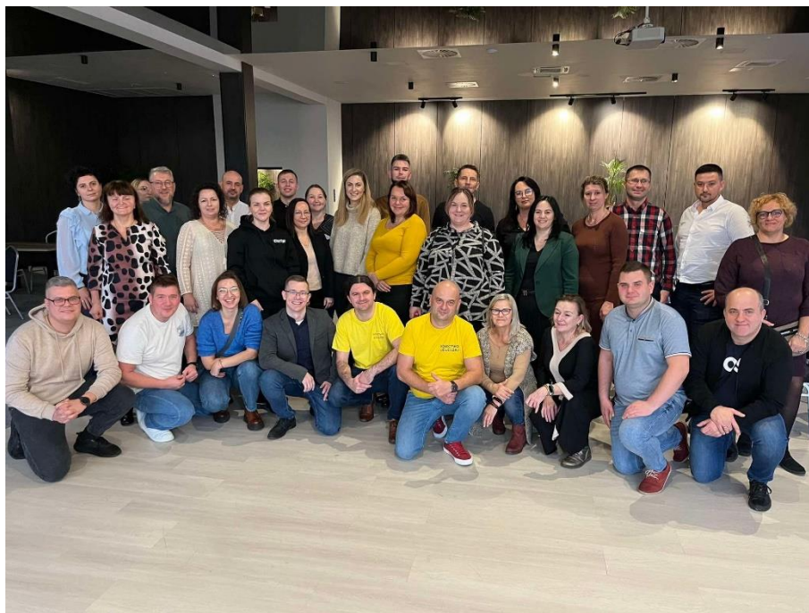
Szkolenie „Tworzenie planów odnowy miejscowości”, organizowane przez Urząd Marszałkowski Województwa Warmińsko-Mazurskiego w Olsztynie