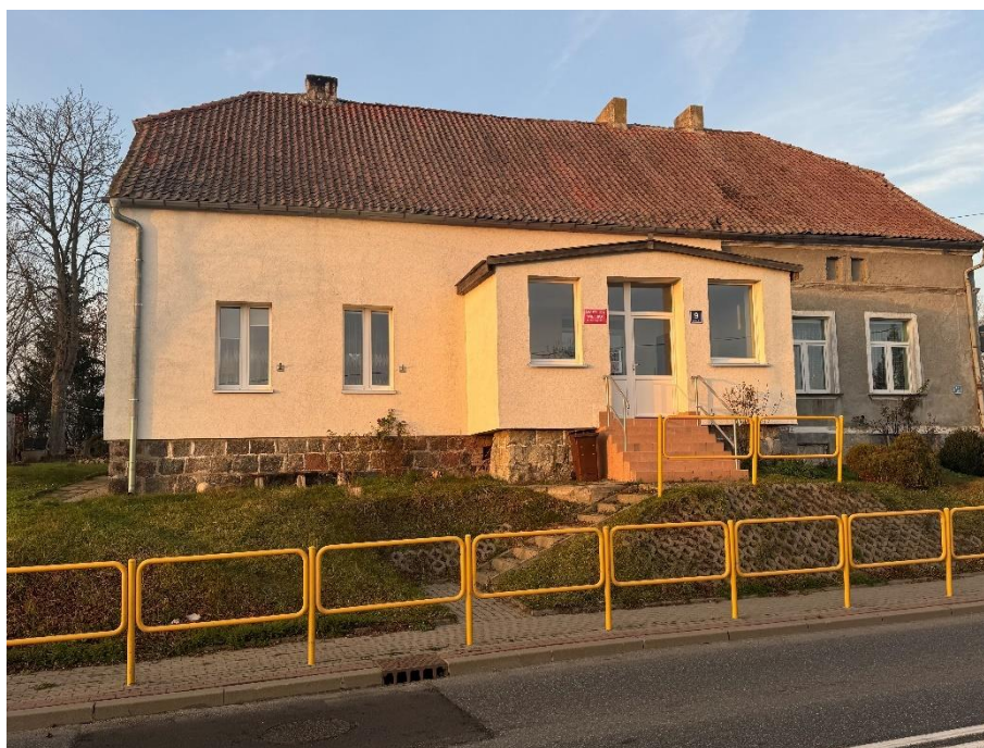
Świetlica Wiejska w Burdajnach

Obiekty te stanowią istotny element infrastruktury wsi, choć pozostają przestrzenią, która mogłaby być lepiej zagospodarowana, by jeszcze bardziej wspierać integrację i aktywność mieszkańców.