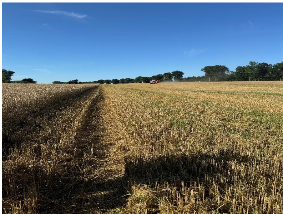
Pola uprawne w Burdajnach