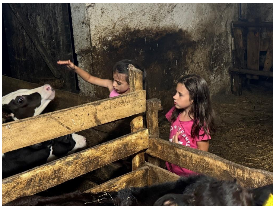
Chów i hodowla zwierząt w Burdajnach