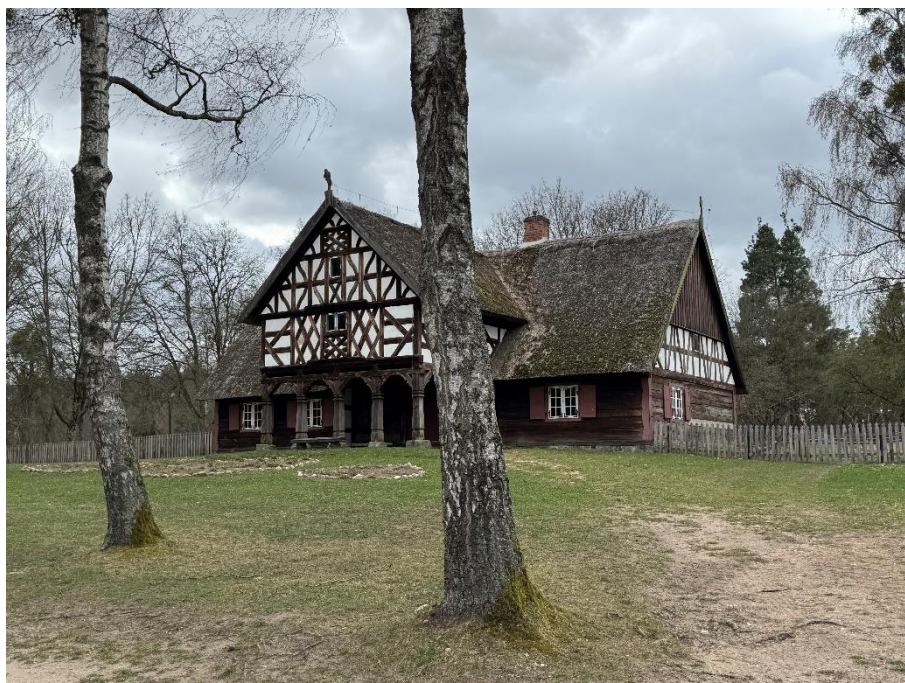
„Chałupa ze wsi Burdajny” w Parku Etnograficznym