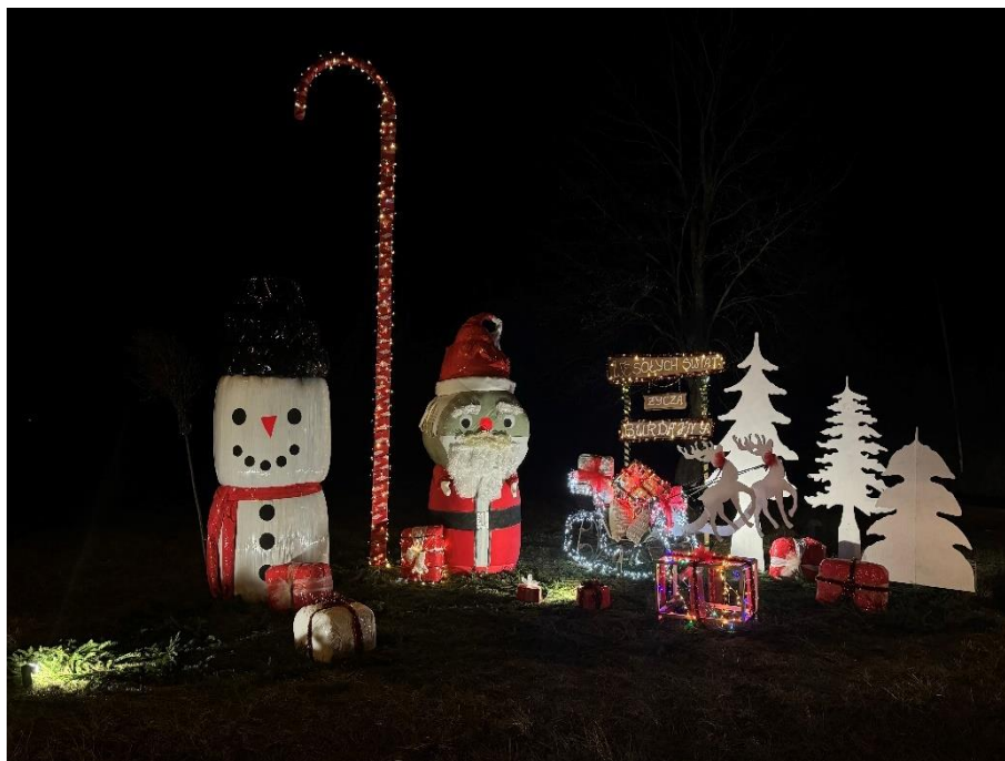
Witacz Świąteczny w Burdajnach