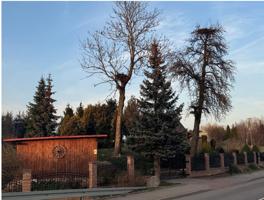
Bocianie gniazda w Burdajnach