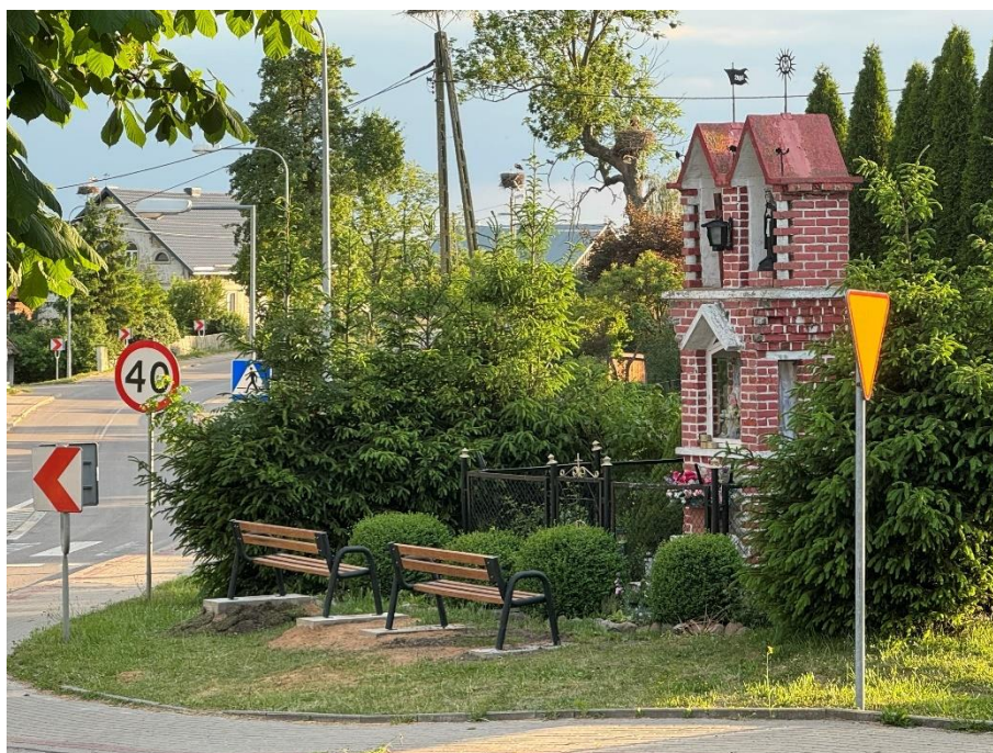
Kapliczka w Burdajnach