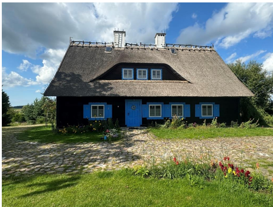
Dom podcieniowy sprzed ok. 300 lat „Plajny – Ogród Dobrych Myśli”