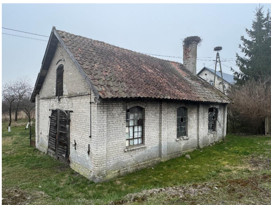
Kuźnia w Burdajnach