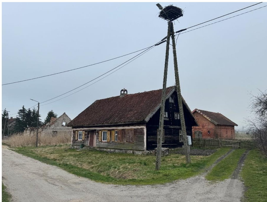
Drewniana chata w Burdajnach